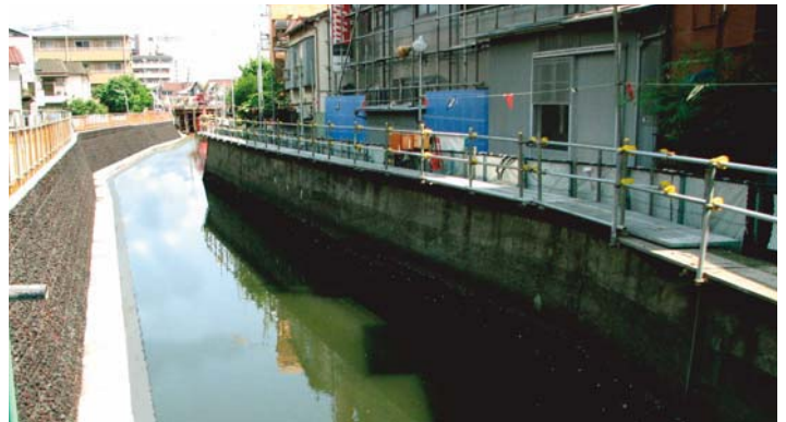
▲完成後の護岸（左側）