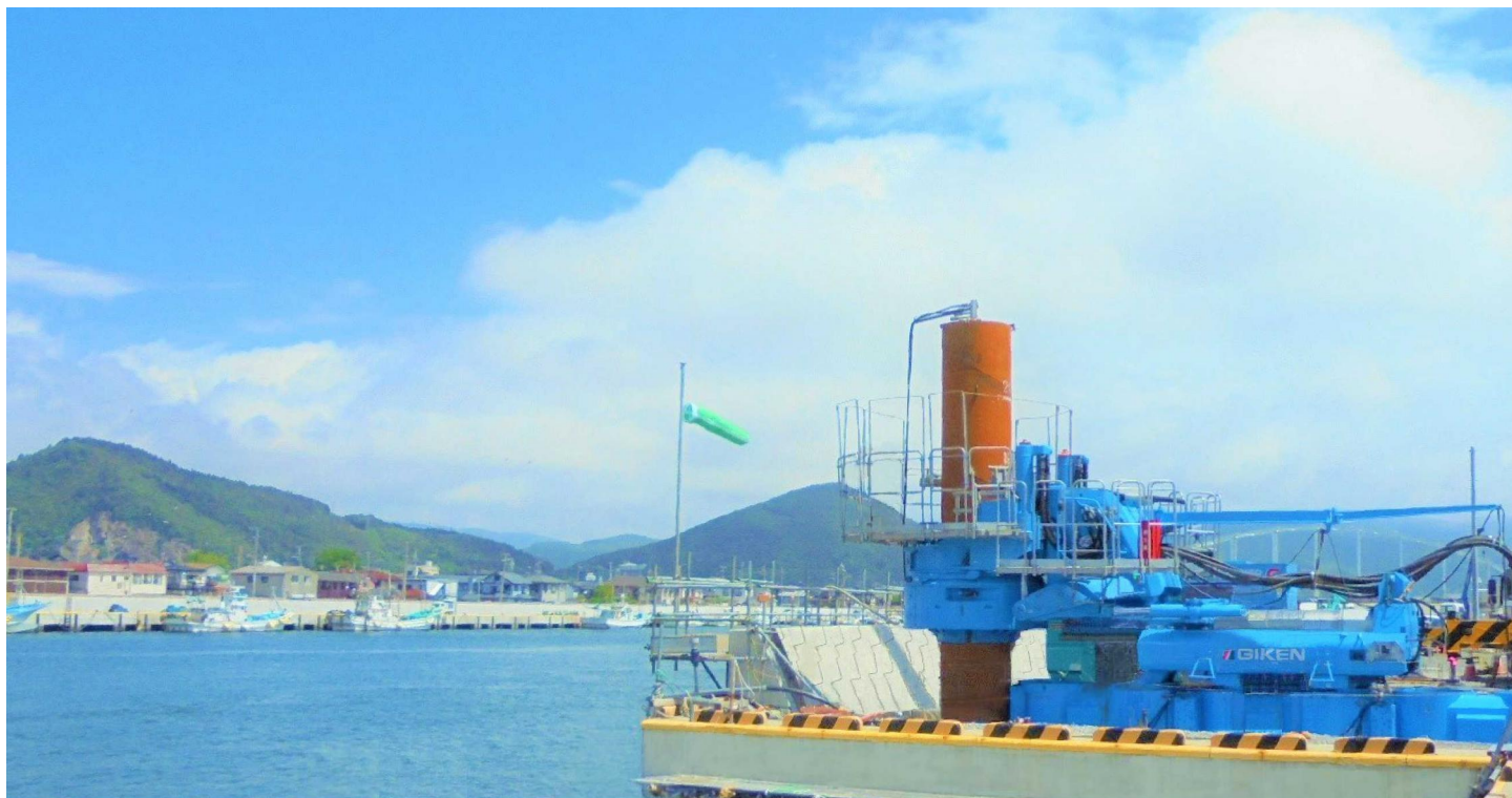
スキップロックアタッチメントを使用して施工