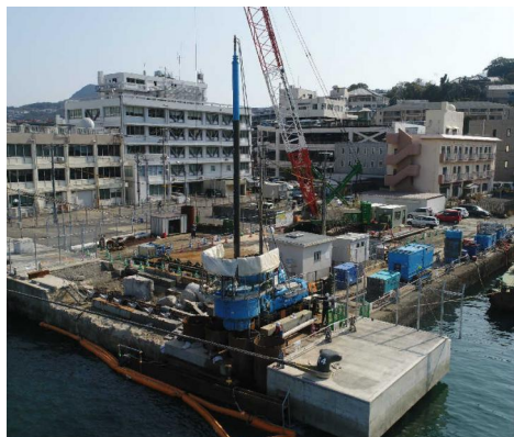
杭間小口径パイプ圧入