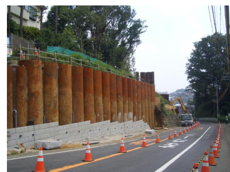
施工後(コンクリート仮取付中)