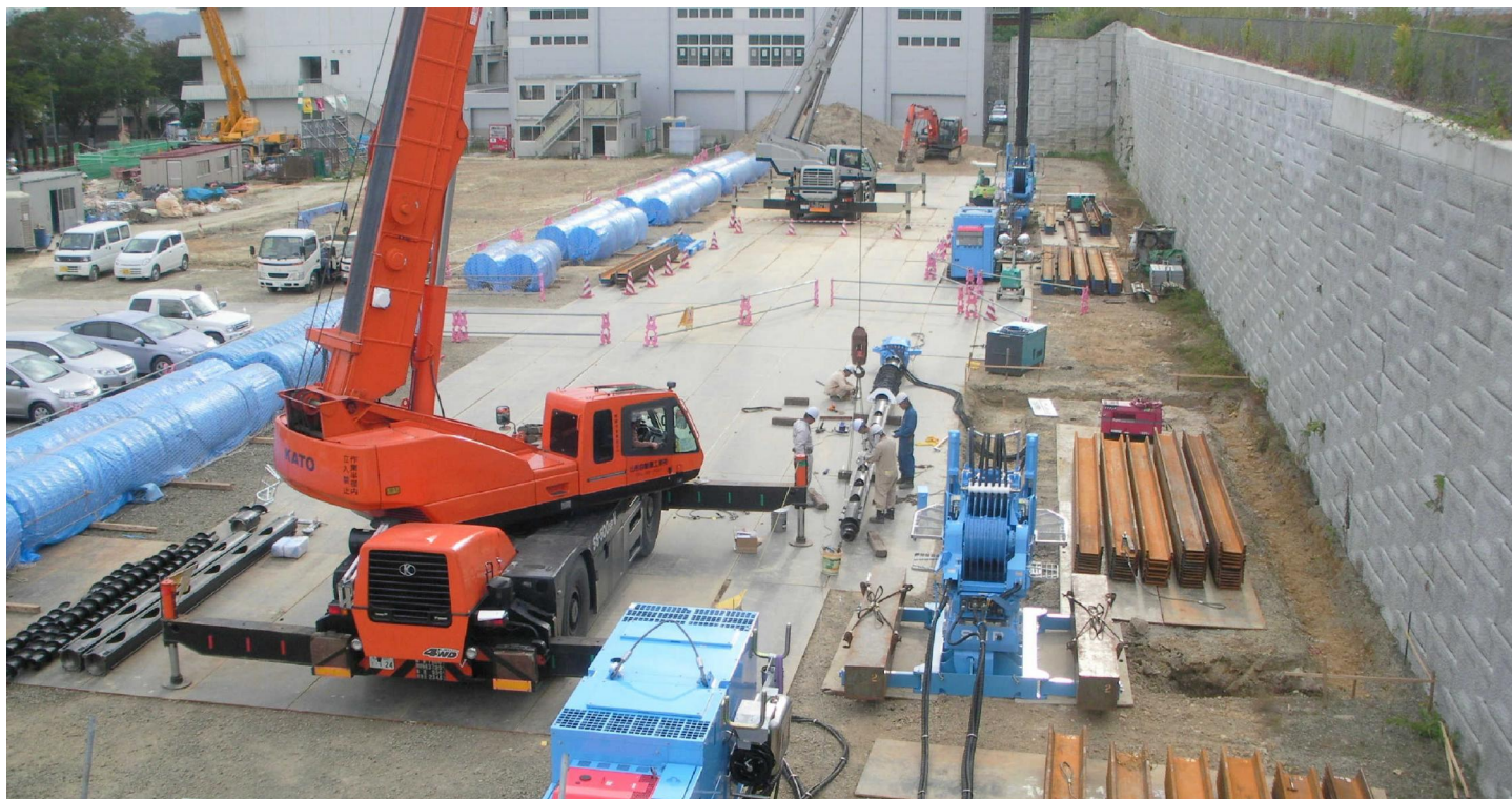
【2台同時施工で工期短縮】