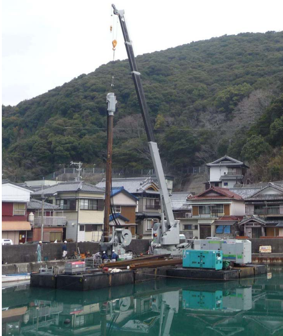
▲システム施工による圧入状況