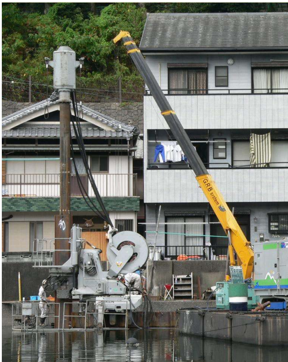
▲システム施工による圧入状況