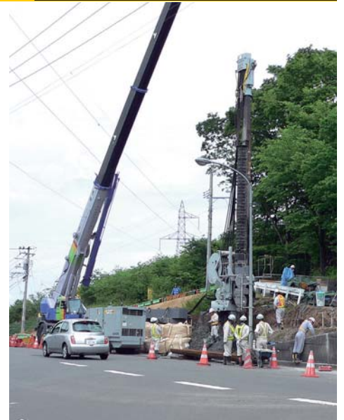
▲ 国道457号への影響なく施工可能