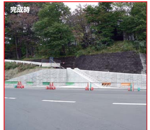
▲ 全面に化粧パネルを設置し、道路擁壁として完成